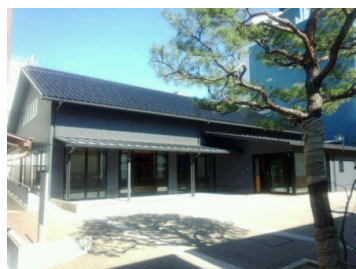
ホール前広場(受付場所)